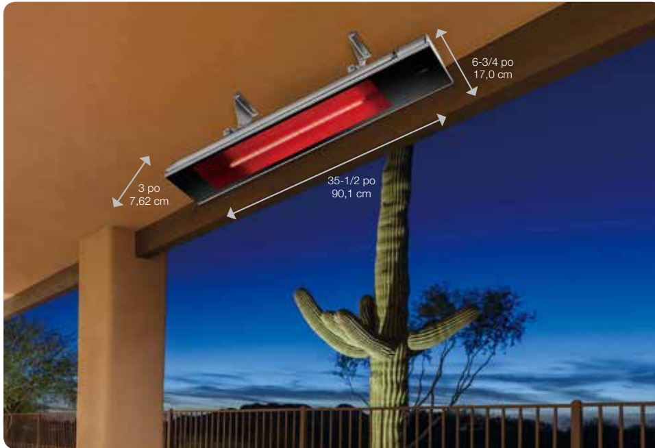
Installation de surface